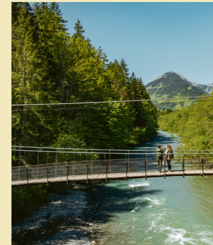
Regionaler Naturpark Gruyère Pays-d'Enhaut.

Graubünden ist in dieser Jahreszeit die wasserreichste Gegend der Schweiz. Der Rhein beginnt hier, am Tomasee, als unscheinbarer Bergbach, und nimmt auf dem Weg ins Tal alles auf, was die umliegenden Täler abgeben, bevor er zu einem der grössten Flüsse Europas heranwächst. In Tälern, die im Sommer kaum jemand aufsucht, stürzen Bäche über Felsen, die im August trocken liegen. Orte, die keine grossen Versprechen machen und sie dann trotzdem halten. Was das konkret bedeutet, welche Wege dorthin führen und was man antrifft, lässt sich auf den nächsten Seiten in Erfahrung bringen.