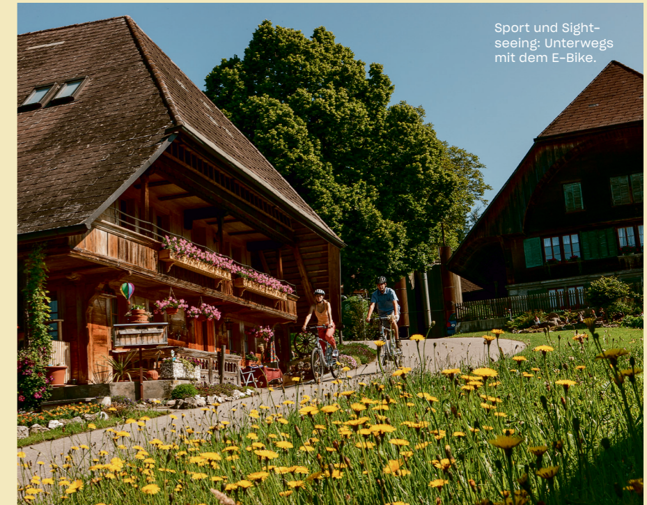
Sport und Sightseeing: Unterwegs mit dem E-Bike.

Auch im Emmental erzählt die Landschaft Geschichten. Die Herzschaufe