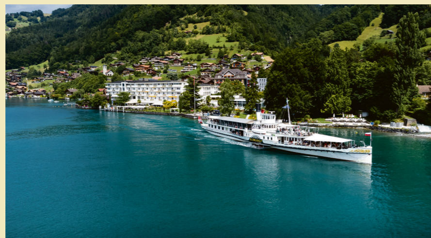
Per Schiff kommt man in der Schweiz besonders angenehm von A nach B.

Fast mediterran wirkt das Nordufer des Walensees. Der Weg von Weesen nach Quinten verläuft dicht über dem Wasser, begleitet von steilen Felswänden und einem überraschend milden Klima. Feigenbäume und Reben gedeihen hier, wo die Sonne lange auf die Felsen trifft. In Betlis stürzt ein Wasserfall in die Tiefe, in Quinten scheint die Zeit langsamer zu gehen. Wer mag, setzt sich auf die Terrasse eines kleinen Restaurants – und kehrt später mit dem Schiff zurück.