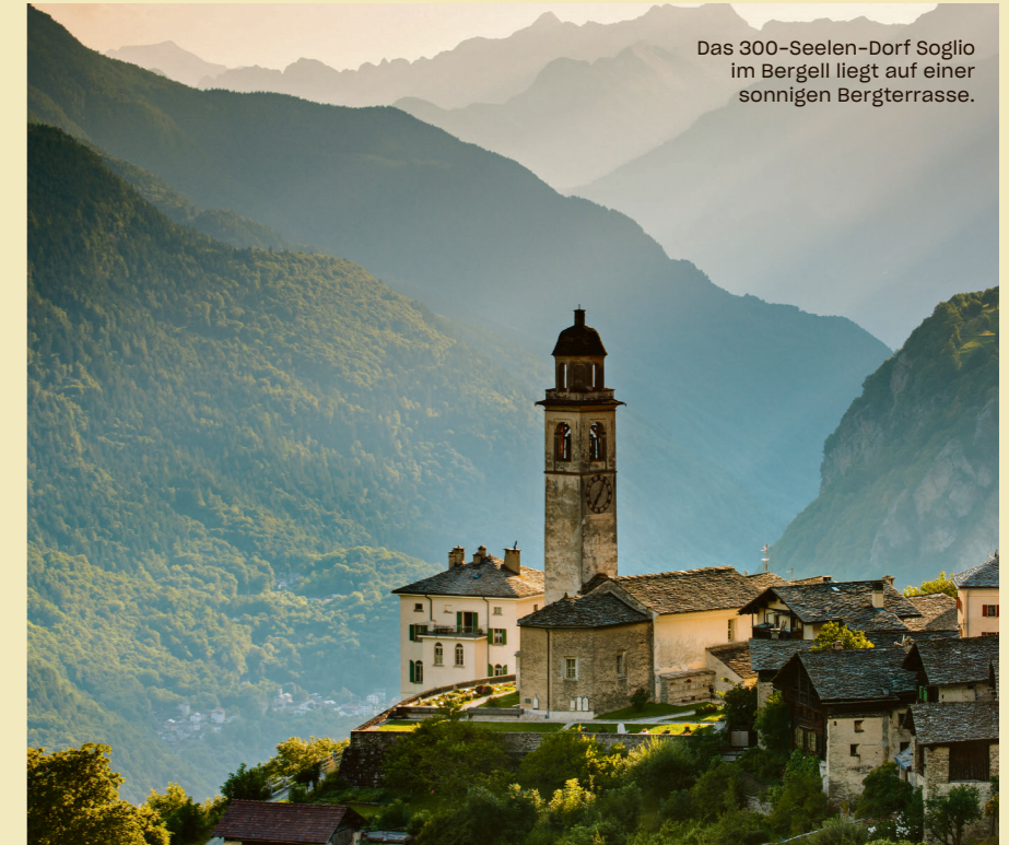
Das 300-Seelen-Dorf Soglio im Bergell liegt auf einer sonnigen Bergterrasse.

Noch ursprünglicher wirkt das Onsernone-Tal im Tessin. Kastanienwälder bedecken die Hänge, tief unten rauscht ein Gebirgsfluss durch enge Schluchten. In Comologno steht der Palazzo Gamboni, ein Herrenhaus aus dem 18. Jahrhundert, in dem einst Künstler und Intellektuelle verkehrten. Heute übernachten Gäste in den hohen Zimmern und hören nachts vielleicht nur den Wind in den Bäumen.