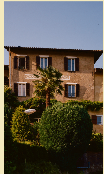
Gleich vor der Tür der Casa Santo Stefano starten die Wanderwege.

Und schliesslich das Malcantone oberhalb des Luganersees: sanfte Hügel, Birkenwälder, blühende Magnolien vor alten Häusern. Die Wege führen durch Kastanienhaine und kleine Dörfer, in denen der Frühling besonders farbig wirkt. Hier beginnt die Saison früher als anderswo. Die Sonne bleibt länger, das Licht ist weich und warm.