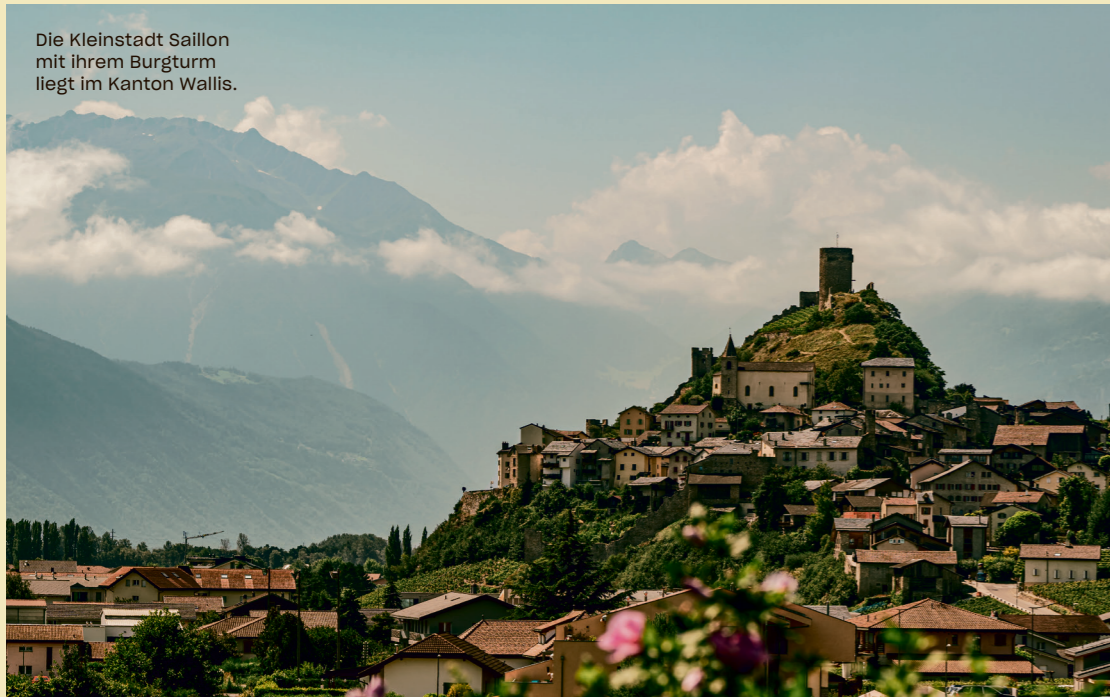
Die Kleinstadt Saillon mit ihrem Burgturm liegt im Kanton Wallis.