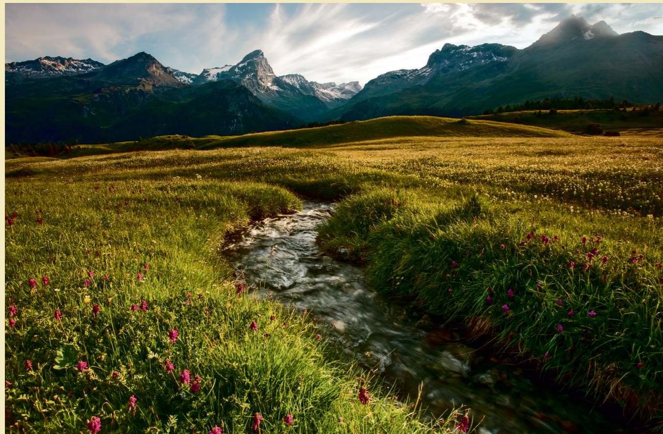
Alp Flix im Parc Ela, dem grössten Naturpark der Schweiz.

Diese vier Elemente – Wasser, Erde, Luft und Feuer – sind die Karte für die folgenden Seiten: Orte und Regionen, die im Frühling mehr sind, als sie versprechen. Ideen zur Planung finden sich auf switzerland.com .